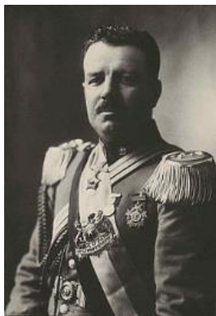
Carlos Ibáñez del Campo

La Logia Verdad N°10, de Santiago, concentraba la mayor cantidad de masones militares.