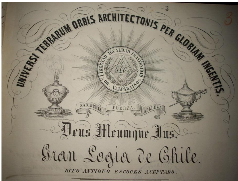
Membrete de la Gran Logia de Chile en el siglo XIX

En Santiago, concurrió a la tercera reunión celebrada por la Logia Justicia y Libertad N°5, el 21 de noviembre de 1864, a la que se había invitado a todos los masones conocidos que residían en Santiago. Ese mismo día fue elegido Hospitalario en su primera Oficialidad.